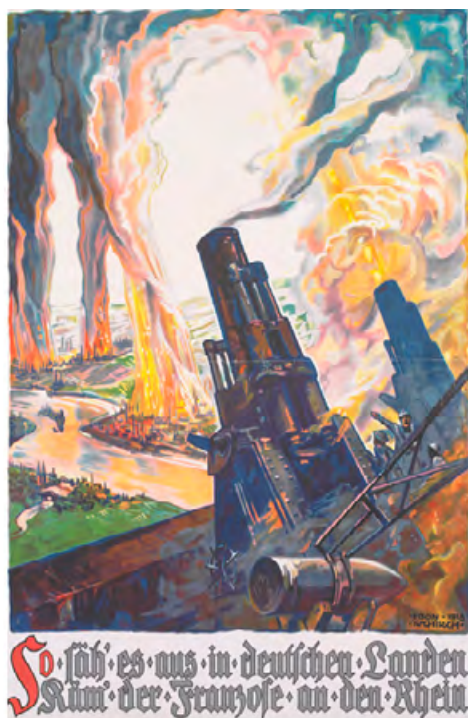
Ил. 2. Така би изглеждало по немските земи, Егон Чирх, 1918