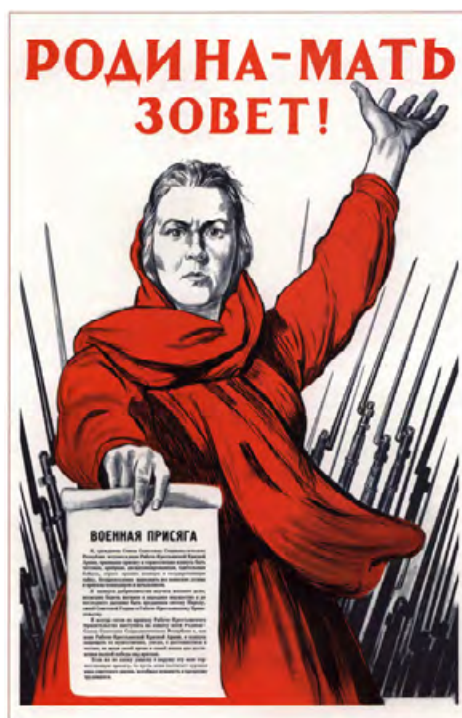
Ил. 3. Родината майка зове, Иракли Тоугзе, 1941