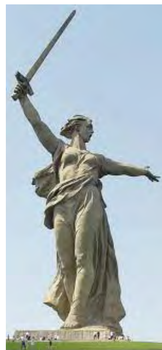
Ил. 4. Родината майка зове, Волгоград, 1967