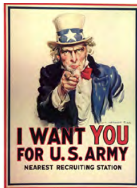
Ил. 1. Чичо Сам, Джеймс Монтгомъри Флаг, 1917

В наши дни следването на примера на древните в изграждането на такива монументални, скъпи, трудоемки агитационни паметници не е рентабилно. Изкуството следва бурната скорост на развитието на техниката, науката и технологиите и не позволява проявата на такъв тип агитация. В този момент много умело, малко след